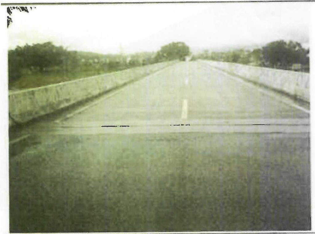
照片 1.1.3 周所桥桥面照