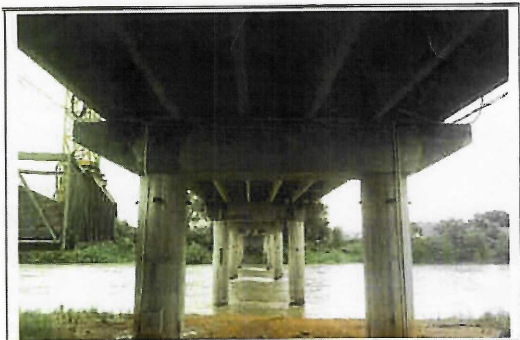
照片 1.1.4 周所桥桥底状况照