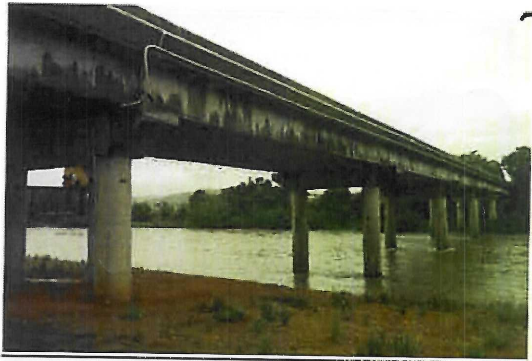
照片 1.1.1 周所桥左侧侧面照