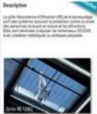
Description La grille d'acier inoxydable (INOX) est un système de protection contre la chute des personnes travaillant en hauteur et est efficace. Elle peut être installée à l'équerre ou dans une pente de 30°.