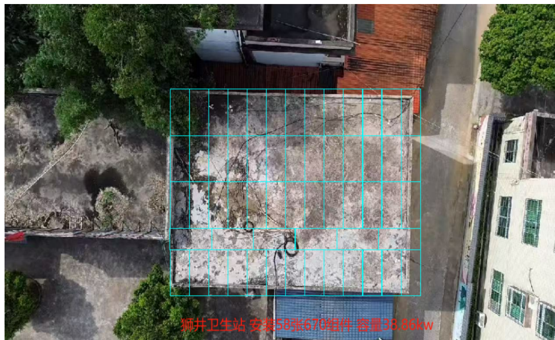
仁化县丹霞街道狮井村卫生站