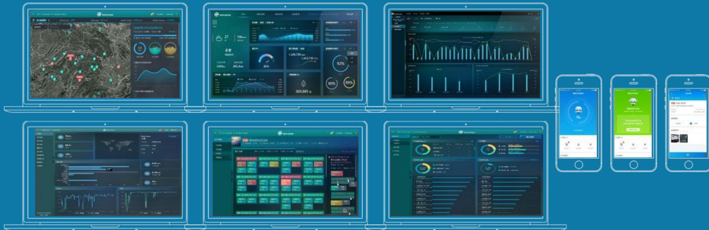
Enlight™ Solar 云端数据实时监控