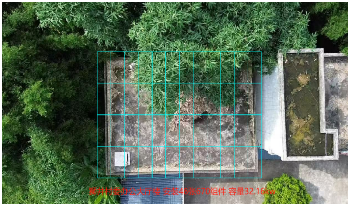
仁化县丹霞街道狮井村村委办公楼副楼