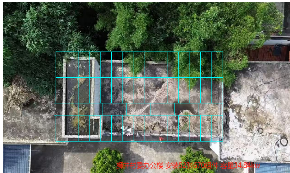
仁化县丹霞街道狮井村村委办公楼