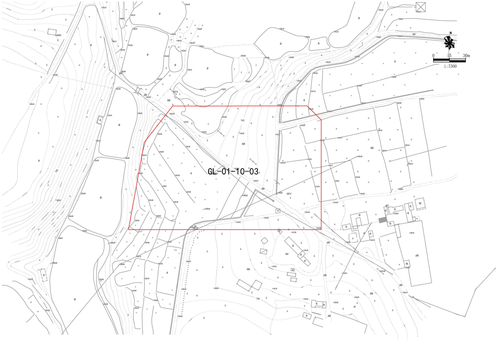
建设用地规划示意图