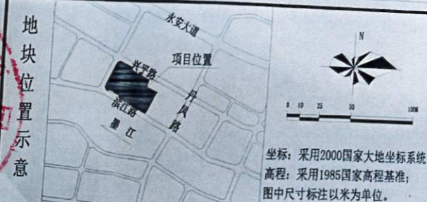
配套设施规划一览表